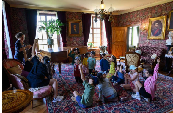
Bild 4 Fantasiereise Richard-Wagner-Museum

Bildimpressionen zum Download hier verfügbar: