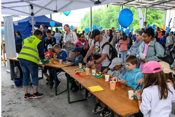
Bild 3 Eigene Früchtespiessli machen, Fun Arena