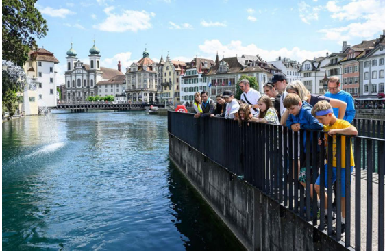
Bild 1 Kleinwasserkraftwerk Mühleplatz, ewl