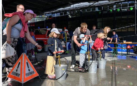
Bild 2 Wasserspritzen mit der Feuerwehr, Fun Arena